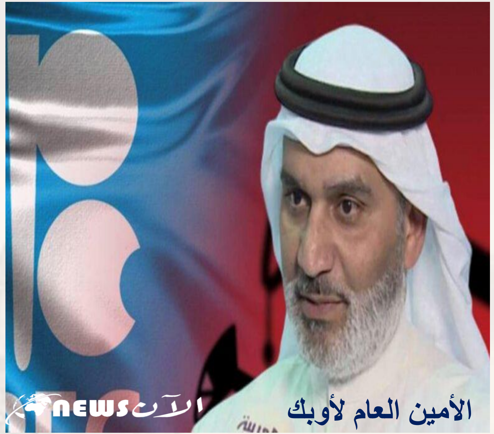
الأمين العام لأوبك

وأضاف انه "إذا نضب النفط غدا، فان الانتاج الغذائي سيتضرر، حيث ان عديد المركبات الضرورية للزراعة مثل الجرارات و الحاصدات و غيرها، ستتوقف عن العمل"، مشيرا الى ان "مواد التغليف الضرورية لتخزين و حفظ الاغذية ستصبح غير متوفرة".