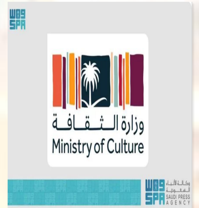
الآن - متابعات

وتهدف وزارة الثقافة من خلال هذا المشروع إلى تأكيد مركزية المملكة بالنسبة للثقافة العربية، وتوثيق خطوات الشعراء العرب على أرض الجزيرة العربية عبر التاريخ، وأماكن نشأتهم وإقامتهم، بما يرفع الوعي تجاه العمق الثقافي والتاريخي للمملكة، ودورها المحوري في تشكيل الثقافة العربية . كما سيعمل المشروع على تفعيل هذه المواقع التاريخية وإثرائها بالمحتوى المعرفي والإرشادي الذي يرفع من قيمتها لدى الزوار الذين سيُفدون لها من داخل المملكة وخارجها