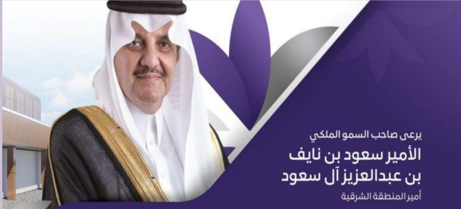
يرعى صاحب السمو الملكي الأمير سعود بن نايف بن عبدالعزيز آل سعود أمير المنطقة الشرقية